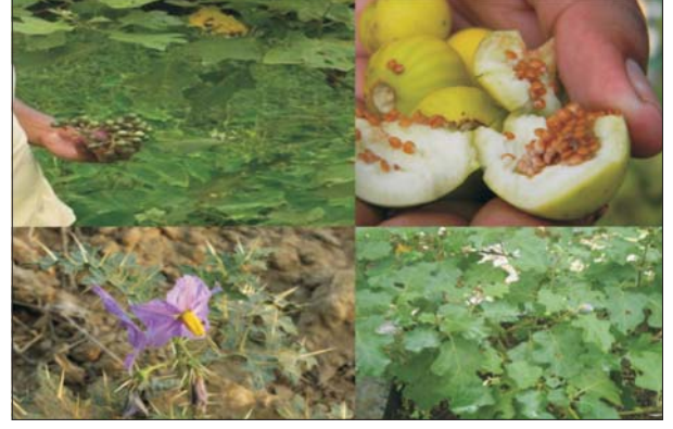
बेंगन की वन्य किस्मों का संग्रहण