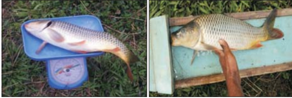
तालाब में उत्पादित अमूर कार्प और गुणवत्ता बीजोत्पादक के लिए ब्रीडर्स का चयन

78-83 घंटों बाद सेने की प्रक्रिया हुई। पानी का तापमान 19-22.8° सेल्सियस के बीच था, जबकि इसका पीएचमान 6.5 और 6.8 के बीच रहा।