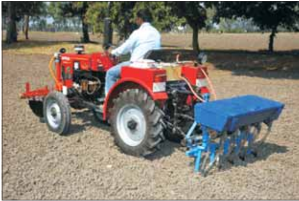
वैविध्यतापूर्ण बीज-उर्वरक उपकरण

बीज और उर्वरक की परिवर्तन होने वाली दर के लिए एक सूक्ष्म प्रोसेसर-आधारित नियंत्रक यंत्र तथा उचित निर्णय-आधार प्रणाली विकसित की गयी जिससे विभिन्न फसलों और प्रत्येक फसल में 5 विभिन्न उर्वरकों का उपयोग किया जा सकता है। इसमें एक छोटा पर्दा-आधारित चयन बोर्ड दिया गया, जिसके माध्यम से किसान/प्रचालक फसल, किस्म, पंक्ति-दर-पंक्ति खाली स्थान, उर्वरक का प्रकार तथा उपयोग, बीज व उर्वरक की दर का चयन कर सकता है। इस प्रणाली का परीक्षण सोयाबीन की जे.एस. 9305 किस्म की बुआई में किया गया जो 350 मि.मी. की पंक्ति-दर-पंक्ति खाली स्थान देकर की गई तथा उर्वरक (डायमोनियम फॉस्फेट) 80 और 100 कि.ग्रा./है. के