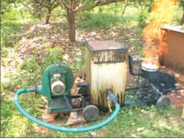
काजू छिलका खली आधारित ड्राफ्ट गैसिफर

10-12 कि.वा. की थर्मल आवश्यकता हेतु उपयोग के लिए उपयुक्त एक काजू छिलका केक आधारित ड्राफ्ट गैसिफर को विकसित किया गया। गैसीकरण को प्रभावित करने वाले विभिन्न प्राचलों का विश्लेषण किया गया तथा इससे बनी गैस की लौ का तापमान 487 0 से. देखा गया।