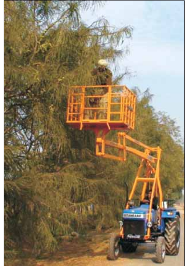
ट्रैक्टर आधारित फल तुड़ाई एवं छंटाई उपकरण

एक ट्रैक्टर माउंटेड पिक पोजिशनर यंत्र को विकसित किया गया, जिसमें ट्रैक्टर के ऊपर एक गतिशील प्लेटफॉर्म लगा होता है, तथा इससे