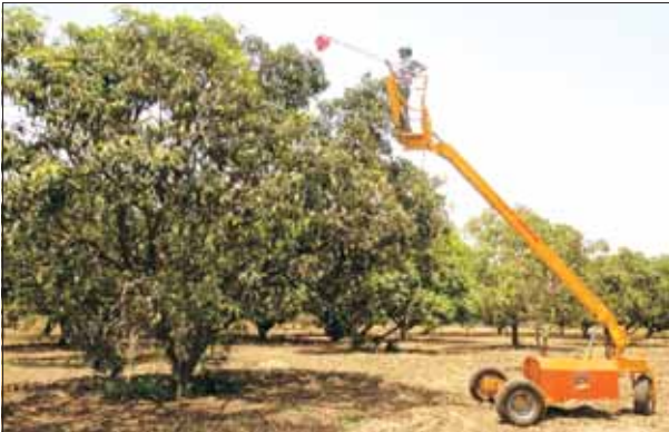
बाग प्रबंधन के लिए स्वचालित हाइड्रोलिक प्लेटफार्म

आम, संतरा, तेलताड़ आदि फलों की तुड़ाई के लिए एक जलीय प्रचालित तीन पहिए वाला सेल्फ-प्रोपेल्ड प्लेटफार्म प्रणाली विकसित की गयी। इसमें 8.2 कि.वा. का पेट्रोल इंजन होता है जो 360° तक कार्य कर सकता है, तथा इसमें हाथ से नियंत्रित करने की भी व्यवस्था मौजूद है तथा सक्रिय प्लेटफॉर्म पर परिचालित होता है। इसका परिचालक विभिन्न ऊंचाइयों से अर्थात् 1.8 से 6 मी. तक की श्रेणी में रहकर परिचालन कर सकता है। आम के फलों की तुड़ाई में देखा गया कि इस यूनिट में ईंधन की खपत 2 ली./घं. थी।