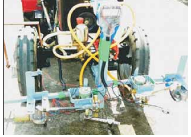
रंग संवेदी स्थल विशिष्ट शाकनाशी यंत्र

दो-पंक्ति वाला एक ट्रैक्टर आरूढ़ अन्तः-पंक्ति स्थल-विशिष्ट शाकनाशी एप्लिकेटर विकसित किया गया, जिसके लेजर सेंसर में हरी खरपतवार की मौजूदगी दर्ज हो जाती है। इस संकेत से एक परिनालिका