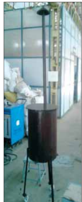
पाइलट स्केल नॉन-इलेक्ट्रिक पाईरोलिसिस यूनिट →

बायोमास को तारकोल में परिवर्तित करने के लिए दो कि.ग्रा. क्षमता वाला एक पाइलट स्केल नॉन-इलेक्ट्रिक पाईरोलिसिस यूनिट विकसित किया गया जिसमें पाईरोलिटिक चैम्बर, कम्बशन चैम्बर, वातायन व्यवस्था, चिमनी प्रोट्रूडिंग सिलेंडर और पाईरोलिसिस गैस निकास द्वार मौजूद होते हैं। तारकोल का कैलोरिफिक मान बीफवुड (Casuarina equisetifolia) के मामले में 7,110 kcal/कि.ग्रा. रहा और मलाई विम्बू (Melia dubia) के मामले में 6,570 kcal/कि.ग्रा. रहा। एक बड़ा पाईरोलिसिस यूनिट जिसकी क्षमता 100 कि.ग्रा. की होती है, भी विकसित किया गया।