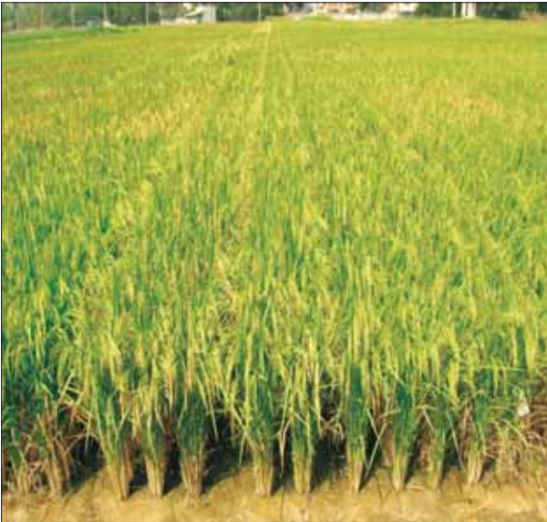
पूसा बासमती 1 की आइसोजेनिक वंशवली, इसमें मुख्य ब्लास्ट प्रतिरोधी जीन हैं

कृषि में जैविक दबाव की प्रतिरोधिता: भारत के विभिन्न भागों से संकलित मैग्नापोर्थे ओराइज़ा, जो कि चावल प्रध्वंस का प्रमुख कारण है, के 80 पृथकों से AVr-Pita जीन की एलल माइनिंग का कार्य पूरा किया गया तथा भिन्नता वाले उपलब्ध अनुक्रम से एलल विशिष्ट मार्कर विकसित किये गये। पूसा बासमती-1 के आइसोजेनिक वंशक्रम विकसित किये गये, जिनकी आनुवंशिक पृष्ठभूमि में पिरामिडिंग 1-3 प्रतिरोधी Pi जीन थे। रोगजनकों की विभिन्न नस्लों के विरुद्ध प्रतिरोधी 7 जीनों का उपयोग किया गया। पपीता गोल धब्बा विषाणु (पीआरएसवी), खीरा मोजेक विषाणु (सीएमवी), मूंगफली कली ऊतकक्षय विषाणु (जीबीएनवी) तथा पीनट मोटल वायरस (PeMoV) के विरुद्ध