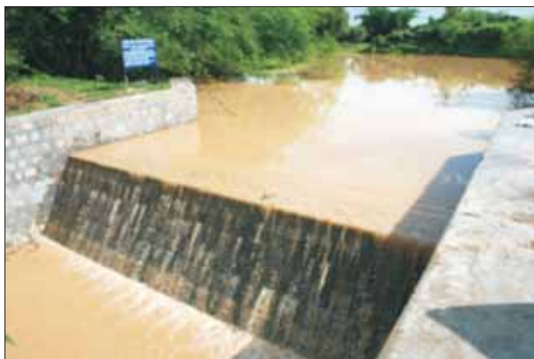
मिर्जापुर में परियोजना के अंतर्गत चैक डैम का निर्माण किया गया

बिन्ध्य क्षेत्र के लिए जल हार्वेस्टिंग आधारित आजीविका मॉडल: पूर्वी उत्तर प्रदेश में स्थित बिन्ध्य क्षेत्र में वर्षा जल के सतही अप्रवाह और नदी स्रोतों के जल की अल्प उपयोगिता के कारण सिंचित जल की उपलब्धता की समस्या सामने आती है जिसके कारण उत्पादकता और फसलचक्र सघनता में कमी पाई जाती है।