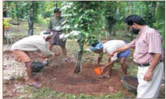
काली मिर्च में पाद विगलन के प्रबंधन हेतु कम लागत वाले श्रम प्रभावी एवं पर्यावरण अनुकूल विकल्प

वर्ष 2006-07 से 2011-12 की अवधि के दौरान 3,544 किसानों को लगभग 1,418 हैक्टर क्षेत्रफल में प्रयोग किये जाने हेतु 19.59 लाख ₹ मूल्य की 27.98 टन ट्राइकोडर्मा विरिडी का वितरण किया गया।