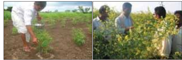
रोपण प्रौद्योगिकी से अरहर में नई क्रान्ति