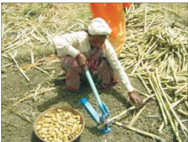
गन्ना बड चिपर का प्रदर्शन

खेती यांत्रिकीकरण: कुल 3,419 हैक्टर क्षेत्रफल को शामिल करते हुए नीरसता में कमी लाने वाली प्रौद्योगिकियों सहित उन्नत टूल्स एवं खेत उपकरणों पर 4,710 प्रदर्शन आयोजित किये गये। कटाई वाले उपकरणों एवं टूल्स पर सर्वाधिक 1,144 प्रदर्शन आयोजित किये गये वहीं इसके बाद रोपण/बुआई उपकरणों पर 988, अंतर जुताई उपकरणों पर 762, पादप सुरक्षा उपकरणों पर 556, वीडर्स पर 373, कटाई उपकरणों एवं प्रसंस्करण उपकरणों पर 297 तथा शेष प्रदर्शन चैफर्स, थ्रेसर, वेजीटेबल प्रेजरवेटर तथा कोकोनट क्लाइबर्स आदि पर किये गये।