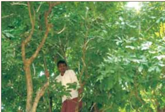
झारखण्ड के रांची जिले में लाख का उत्पादन

कृषि विज्ञान केन्द्र द्वारा किसानों को सदस्य बनाकर एक बूड़ लाख (लाख बीज) बैंक बनाया गया है। इस बैंक के माध्यम से लाख की खेती करने वाले किसानों को गुणवत्ता बूड़ लाख की समय से आपूर्ति सुनिश्चित की जाती है।