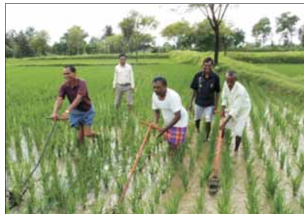
केवीके, कोटा में कोनो-वीडर में ओएफटी

इसके साथ ही पशुधन उत्पादन एवं सुरक्षा के विषयी क्षेत्रों के अंतर्गत पशुधन, पॉल्ट्री एवं मात्स्यिकी उद्यमों पर 461 परीक्षण कर 68 स्थानों पर कुल 43 प्रौद्योगिकीय युक्तियों में भी सुधार किया गया। इसके अलावा, 8 स्थानों पर 62 परीक्षणों के आयोजन द्वारा 5 महिला विशिष्ट आय सृजन प्रौद्योगिकियों में भी सुधार लाया गया। प्रमुख उद्यम थे: मशरूम खेती, मधुमक्खी पालन तथा पोषणिक बगीचे।