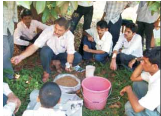
केवीके, उत्तर कन्नड़ा में काली मिर्च में सीएमएस तकनीक का प्रदर्शन

कृषि विज्ञान केन्द्रों द्वारा समय से किसानों को परामर्श सेवा प्रदान कर उन्नत प्रौद्योगिकियों के बारे में किसानों के बीच जागरूकता का सृजन करने के उद्देश्य से प्रसार कार्यक्रम आयोजित किये जाते हैं। कृषि विज्ञान केन्द्रों द्वारा कुल 4.86 लाख प्रसार कार्यक्रमों/गतिविधियों का आयोजन किया गया जिनमें 170.16 लाख किसानों तथा 2.61 लाख प्रसार कार्मिकों ने भाग लिया। कृषि विज्ञान केन्द्रों द्वारा जिलों में व्यापक प्रसार के लिए इलैक्ट्रॉनिक व प्रिन्ट मीडिया के माध्यम से 1.30 लाख प्रसार कार्यक्रम आयोजित किये गए। इनमें शामिल थे: टीवी कार्यक्रम, रेडियो वार्ता, सीडी/डीवीडी, प्रसार साहित्य, समाचार-पत्र, समाचार-पत्र कवरेज, तकनीकी बुलेटिन/रिपोर्ट/पुस्तकें, लोकप्रिय लेख, लीफलेट्स, फोल्डर तथा पुस्तकें/बुकलेट्स आदि।