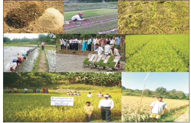
गारोहिल्स और धलाई में एसआरआई

धान की खेती के लिए एसआरआई पद्धति-धलाई, त्रिपुरा और दक्षिण गारो पहाड़ी, मेघालय में अभूतपूर्व सफलता: दक्षिण गारो पहाड़ी पर स्थानीय धान की किस्म की औसत उत्पादकता 1.5 टन/हैक्टर थी और धलाई जिले में 2.1 टन/हैक्टर थी। एसआरआई पद्धति से रंजीत किस्म को उगाने के बाद यह उत्पादकता दक्षिण गारो पहाड़ी में 4.8 टन/हैक्टर तक पहुंच गई जबकि धलाई (त्रिपुरा) में नवीन किस्म को एसआरआई पद्धति में अपनाने के बाद उत्पादकता 3.7 टन/हैक्टर तक पहुंच गई। दोनों स्थानों पर एचवाईवी और एसआरआई को अपनाने के बाद आय में औसत वृद्धि 6,700 रुपये/हैक्टर/वर्ष तक हो गई।