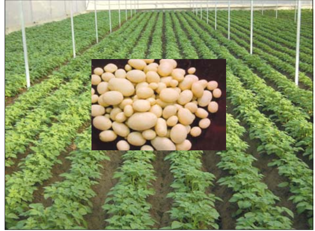
व्यवसायिक मिनीट्यूबर्स हेतु नेट हाउस में आलू की खेती

मल्टीप्लैक्सड माइक्रोसेटेलाइट मार्कर्स का प्रयोग करके हाई-श्रोपुट जीनोटाइपिंग, रेनआउट शेल्टर्स में सूखा सहने वाली फेनोटाइपिंग, माइक्रोब्स और हानिकारक तरल रसायनों के सुरक्षित रख-रखाव की सुविधा, ईएमसीसीडी प्रणाली, मिनीट्यूबर के लिए नेट हाउस का निर्माण, मसालों के बीज के लिए मोबाइल सीड प्रोसेसिंग इकाई,