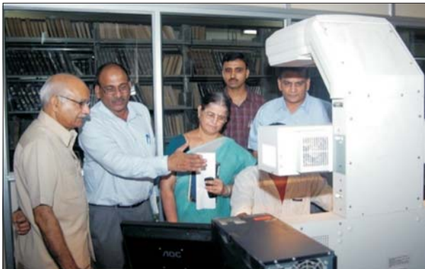
हाई रेजोल्यूशन स्कैनर्स की मदद से भा.कृ.अनु.सं. के दस्तावेजों की डिजिटल रूपांतरण की प्रक्रिया

भा.कृ.अनु.प. और इसके संस्थानों की 20 वेबसाइट दोबारा डिजाइन की गई हैं जिन्हें बनाने में आधुनिक आईटी टूल्स और एक रूपता बनाए रखने हेतु एक समान मार्ग निर्देशनों का प्रयोग किया गया। अब इन वेबसाइट पर जानकारी लेने वालों की संख्या में बढ़ोतरी हुई है (3.3 लाख विजिटर प्रतिमाह)। ऑफलाइन मोड में छह डिग्री पाठ्यक्रमों के लिए लगभग 150 ई-कोर्स विकसित किए गए हैं।